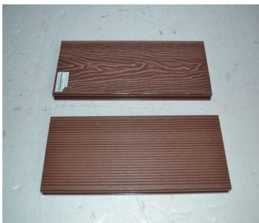
Vorder- und Rückansicht

WPC 3D-geprägte Terrassendiele, 25 x 148 mm, wellenstruktur/fein